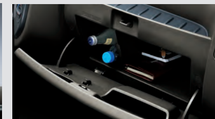
Ngăn chứa đồ phía trước rộng rãi, tiện ích.