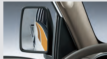
Gương chiếu hậu góc rộng.