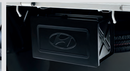
Hộp chứa dụng cụ.