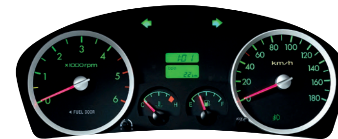
Bảng taplo phong cách Sedan

Bố cục cụm đồng hồ thiết kế khoa học, hiện đại, giúp thể hiện các thông số một cách rõ ràng, dễ nắm bắt.