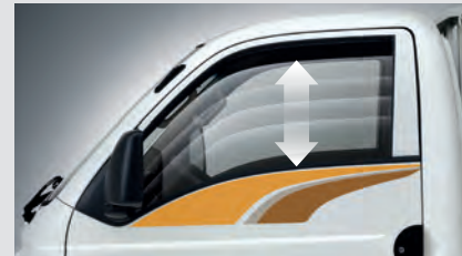
Cửa sổ điều khiển điện.