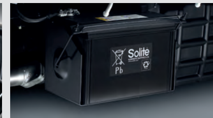
Acqui dung lượng 90 AH.