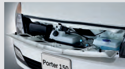
Ốp trước giúp dễ dàng quan sát và bảo trì các chi tiết bên trong.