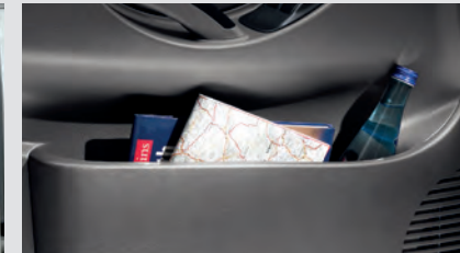
Hộc đựng đồ ở cửa xe.