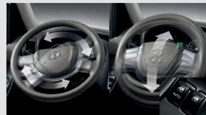
Vô-lăng trợ lực lái điện và có thể điều chỉnh lên-xuống.