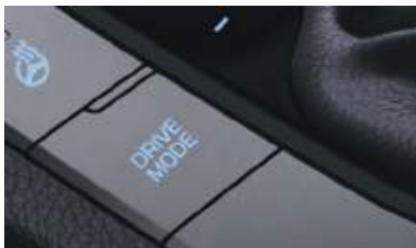
Chế độ lái tích hợp