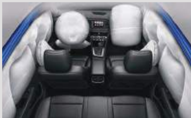
6 Túi khí