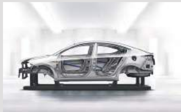
Hệ thống khung gầm (AHSS) chắc chắn