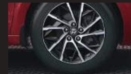
Lazang hợp kim 17 inch thể thao

Thiết kế đặc biệt với lưới tản nhiệt thác nước cascading đậm dấu ấn thương hiệu, cụm đèn pha full LED cá tính và dải đèn LED ban ngày sắc sảo