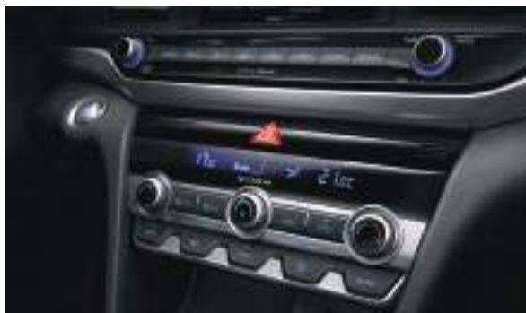
Điều hòa tự động 2 vùng độc lập, lọc khí ion