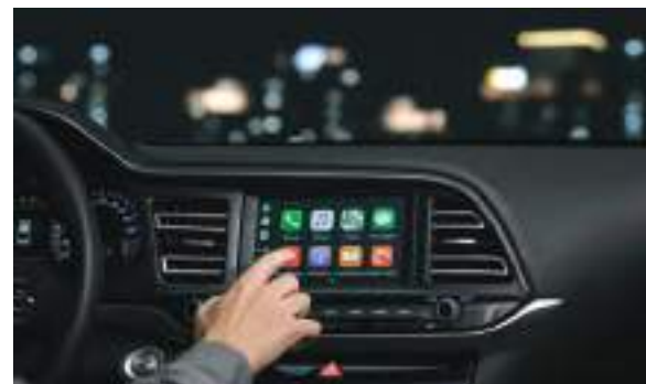
Màn hình cảm ứng 7 inch