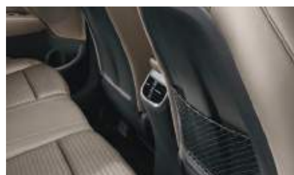
Cửa gió điều hòa hàng ghế sau