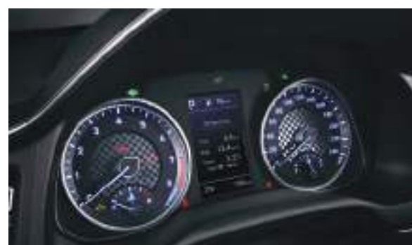
Màn hình taplo 4.2 inch LCD