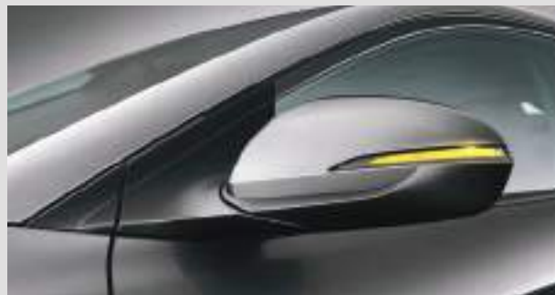
Gương chiếu hậu gập điện, chỉnh điện, tích hợp báo rẽ