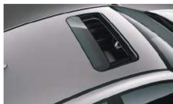
Cửa sổ trời chỉnh điện