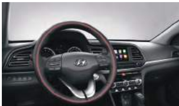
Vô lăng bọc da, có sưởi

Hyundai Elantra mới với nội thất được trang bị tiện nghi, hướng tới người lái nhằm đem lại tối đa sự thoải mái và tiện nghi.