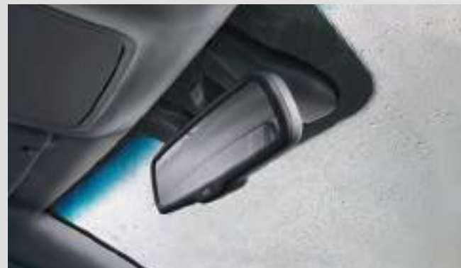
Gương chống chói ECM tích hợp la bàn Cảm biến gạt mưa tự động