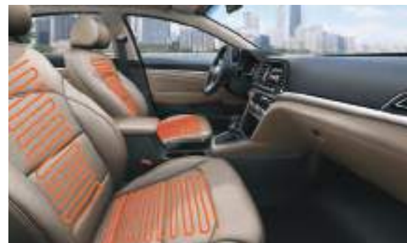
Sưởi hàng ghế trước