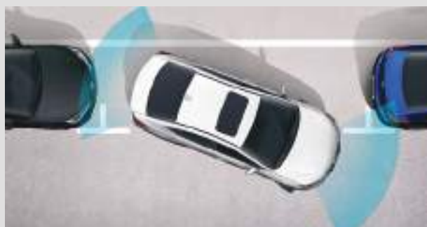
Hệ thống hỗ trợ đỗ xe với cảm biến trước sau