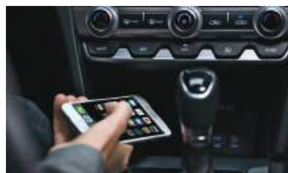
Sạc điện thoại không dây chuẩn Qi