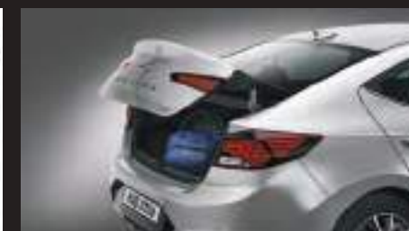
Cốp điều khiển từ xa thông minh