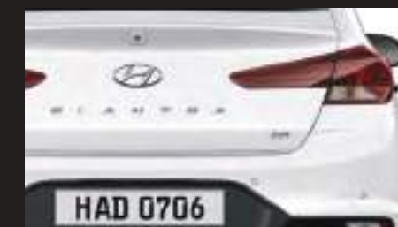
Logo hiện đại, cá tính