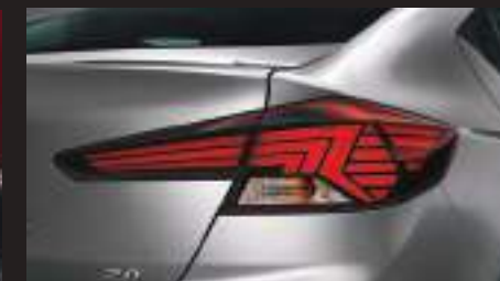
Đèn hậu dạng LED cá tính